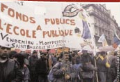
Manifestation lors du projet de révision de la loi Faloux en 1994.