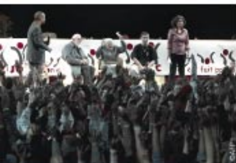
Rassemblement de la Jeunesse Ouvrière Chrétienne à Bercy en présence de l'abbé Pierre et de Soeur Emmanuelle.