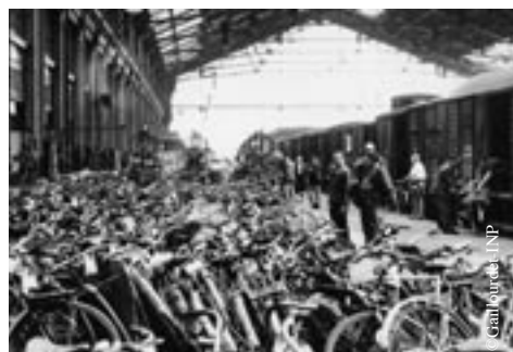
Pour les vacances des milliers de bicyclettes sont chargées dans les wagons comme ici à la gare de Lyon en juillet 1948.

Le vœu d' André Philip est en partie exaucé. Les MJC pratiquent la cogestion, exercice démocratique qui réunit les adhérents, les travailleurs de l'institution et les représentants des pouvoirs publics et des collectivités locales. La direction de l'éducation populaire et des mouvements de jeunesse qui se constitue au sein de l'éducation nationale est confiée à Jean Guehenno.