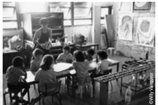
Ateliers organisés par la mairie d'Aubervilliers pour des enfants défavorisés.

Les mouvements d'éducation populaire ne recevaient des fonds que d'adhérents et de donateurs et leurs animateurs étaient bénévoles. Désormais, on assiste à une institutionnalisation et à une professionnalisation croissante : création de l'INEP (Institut national d'Éducation Populaire) devenu Institut National de la Jeunesse et de l'Éducation (INJEP), du FONJEP (Fonds de Coopération de la Jeunesse et de l'Éducation populaire) qui gère les crédits destinés à la formation professionnelle des animateurs.