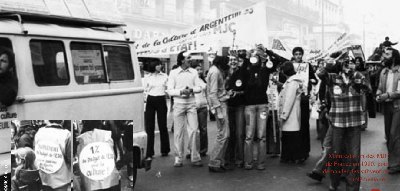
Manifestation des MJC de France en 1980, pour demander des subventions supplémentaires.

Cette professionnalisation sera renforcée à partir des années 60 avec l'animation socioculturelle qui donne lieu à toute une série de diplômes d'État.