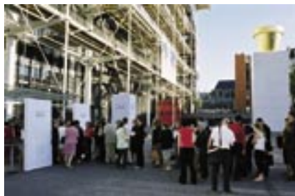
Le centre Pompidou, un des lieux d'exposition de la capitale qui attire un grand public.

Beaucoup de fédérations sportives sont en croissance et des sports réservés autrefois aux classes sociales favorisées comme le tennis se sont démocratisés. On compte en France près de 15 000 000 de licenciés toutes disciplines confondues.