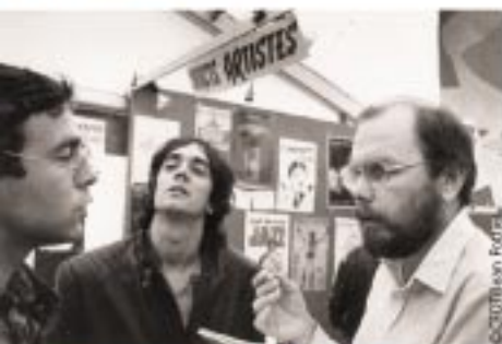
Rencontre entre syndicalistes et artistes.

Le courant laïque trouve son inspiration chez Condorcet : l'éducation est la voie qui mène à la citoyenneté et à la démocratie.