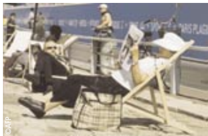
Paris Plage une opération, conçue pour ceux qui ne partent pas en vacances, plébiscitée par la population parisienne.

SELON LES VŒUX DE LÉO LAGRANGE, LA PRATIQUE SPORTIVE S'EST BEAUCOUP DÉVELOPPÉE.