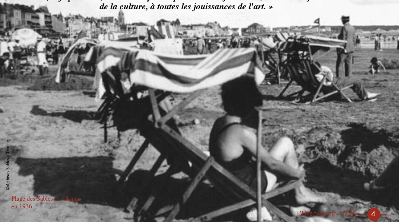
Plage des Sables d'Orlonne en 1936.

« Je ne crois pas que ni la révolution sociale, ni l'état intermédiaire qui la prépare et en rapprochera le moment, doivent avoir uniquement pour objet de procurer au prolétariat un bien-être matériel. Le prolétariat, qui est la force agissante du monde par son travail, a droit, si je puis dire, à toutes les fleurs que ce travail fait naître, à toutes les jouissances de la culture, à toutes les jouissances de l'art. »