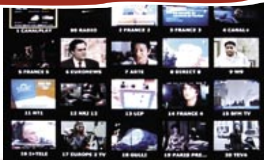
La télévision est le premier vecteur de la culture et de la communication.

Comment repenser l'éducation face aux nouveaux moyens de diffusion du savoir et de la culture que sont la télévision, Internet, l'informatique ?