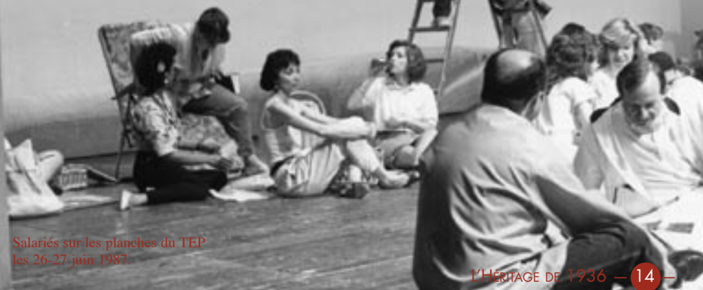
Salariés sur les planches du TEP les 26-27 juin 1987.