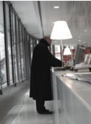
Bureau d'accueil du Ministère de la culture.