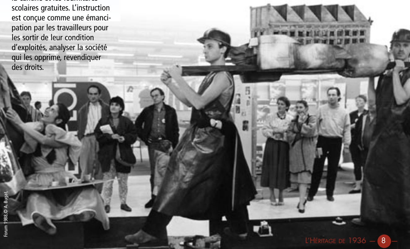
Forum 1988 © A. Bugat.

Ici et là naissent des universités populaires où des intellectuels enseignent au peuple les bases du savoir et des musées du travail qui mettent en lumière un patrimoine et une culture ouvrière.