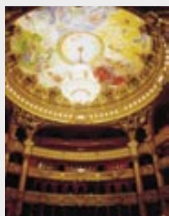
La peinture du plafond de l'Opéra Garnier confié à Chagall par Malraux, souleva une grande polémique.

pendant toute la période au pouvoir du Général de Gaulle de 1959 à 1969. Il privilégie les auteurs et les œuvres. Il veut faire des Maisons de la Culture, dont la première est inaugurée au Havre en 1961 et dont chaque département aurait dû être doté, des temples voués à la création. Mais il n'y en a à ce jour que 7 sur tout le territoire français.