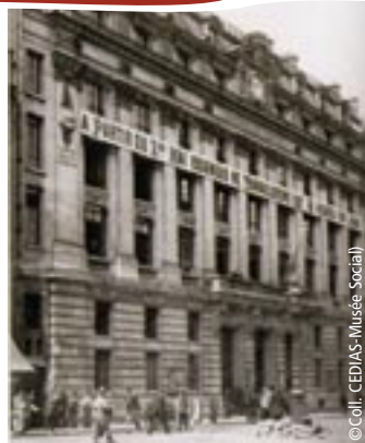
Bourse du Travail de Paris.

Sous la III e République naissent les premières Bourses du Travail qui se forment en fédération avant de fusionner avec la CGT et dont l'un des buts est d'assurer l'éducation primaire, professionnelle, sociale mais aussi socialiste des travailleurs. Les Bourses mettent en place des bibliothèques comme celle de Paris qui comprenait au début du XX e siècle 2700 ouvrages.