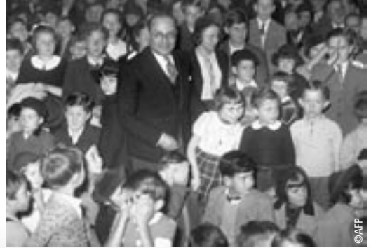
Jean Zay entouré d'enfants dans un théâtre de marionnettes.