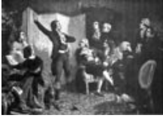
Le chant de la Marseillaise.

En matière de culture et d'éducation populaire, le Front populaire aura une postérité. Il a aussi un héritage. C'est celui de la Révolution française. Un homme l'a incarné mieux que quiconque : Condorcet. Mathématicien, philosophe, économiste, homme politique, défenseur de toutes les causes, il a lutté pour l'égalité des droits de toute l'humanité : noirs, protestants, juifs, femmes. Premier des républicains, avant même Robespierre, il vote contre la mort du roi par aversion pour la peine de mort.