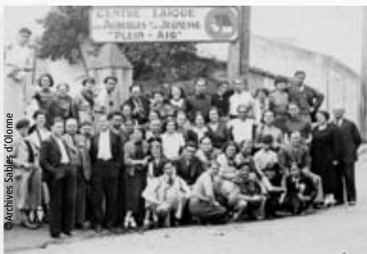
les auberges de jeunesse fondées en 1907 par l'Allemand Richard Schirmann se développent en France sous l'impulsion de Léo Lagrange.

L'image perdue de ces Français qui, en vélo ou en train vont pour la première fois voir la mer, de ces jeunes gens et de ces jeunes filles gais et sportifs qui fréquentent les auberges de jeunesse alors que résonne le « Y a d'la joie » de Charles Trénet.