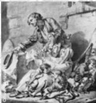
Avant la Révolution, famille réduite à la mendicité.