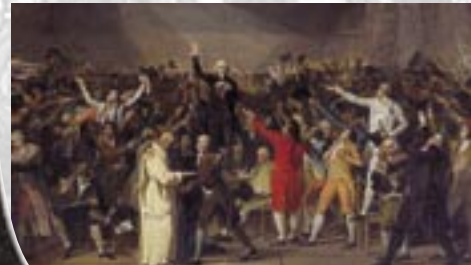
"Le Serment du Jeu de Paume" de David. L'assemblée jure de ne pas se séparer avant d'avoir donné une constitution à la France.

Il avait compris que le peuple n'avait qu'une arme pour être vraiment libre : l'éducation. Condorcet prône une instruction « universelle », « égale », « complète », gratuite, indépendante de tout dogme et de tout pouvoir. « Son rapport et projet de décret sur l'organisation générale de l'instruction », approuvé le 18 avril par un comité élu par l'Assemblée nationale pose les premières bases de l'éducation populaire : l'instruction doit être universelle, c'est-à-dire s'étendre à tous les citoyens. Elle doit être répartie avec toute l'égalité que permettent les limites nécessaires de la dépense, la distribution des hommes sur le territoire, et le temps plus ou moins long que les enfants peuvent y consacrer. Elle doit, dans tous les âges de la vie, assurer la facilité de conserver leurs connaissances ou d'en acquérir de nouvelles... Nous avons observé que l'instruction ne devrait pas abandonner les individus au sortir de l'école, qu'elle devait embrasser tous les âges, qu'il n'y en avait aucun où il ne fut possible et utile d'apprendre ».