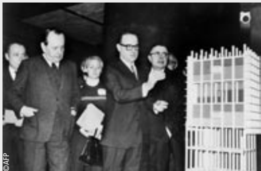
André Malraux, ministre d'État chargé des affaires culturelles, inaugure la Maison de la culture qui s'élève près du Stade d'ouverture des JO de Grenoble, le 3 février 1968.