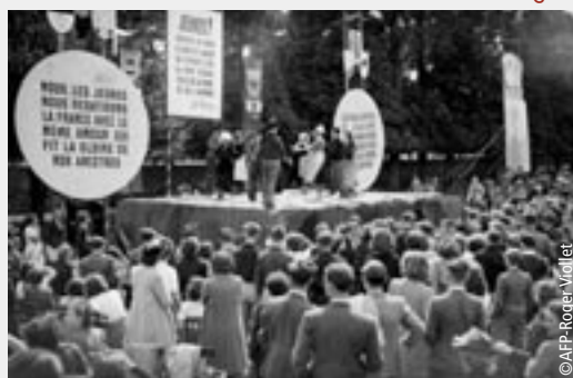
Fête folklorique de la jeunesse, août 1941

Le 4 octobre 1944, naît, sous la houlette d'André Philip, commissaire à l'intérieur du gouvernement provisoire d'Alger, « la République des Jeunes » qui allait devenir la Fédération Française des Maisons de Jeunesse et de la Culture.