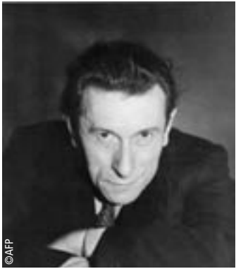
Charles Dullin, acteur, metteur en scène et directeur de théâtre.

Pour Léo Lagrange, les loisirs sont « autre chose que le non-travail : une ouverture au monde ». Le jour même de sa nomination, il en donne le sens :