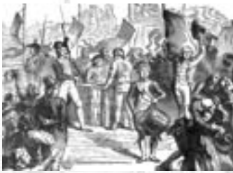
Hommes et adolescents viennent s'offrir à la Patrie.