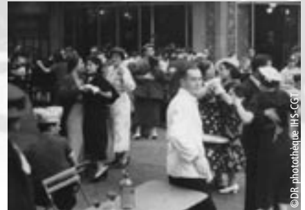
Bal populaire pendant les grèves de 1936.