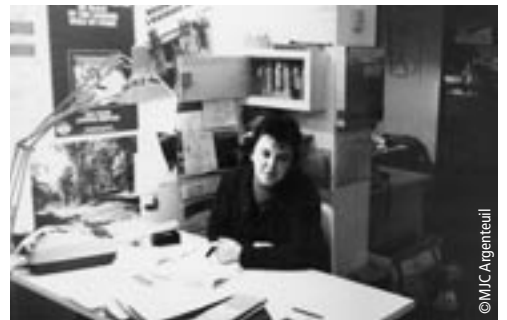
Bureau d'une MJC