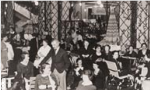
Grève dans la bonne humeur aux galeries Lafayette.

Mais entre temps, un mouvement de grève d'une puissance inégalée éclate. Usines et bureaux sont occupés par leurs salariés dans une atmosphère de joie et de fête. Expression d'une dignité ouvrière affirmée, c'est un mouvement sans haine de tout un peuple qui pour une des rares fois dans l'histoire de France a le sentiment que les gens qui le dirigent ne s'oppose pas à lui mais le soutient.