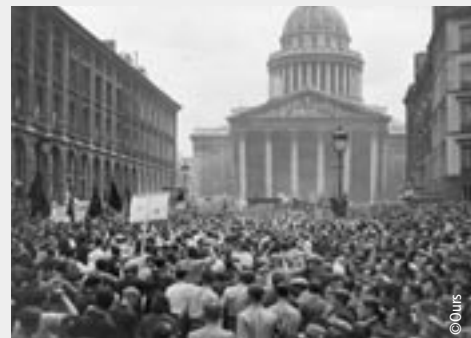
Manifestation du Front populaire devant le Panthéon

Léon Blum , leader incontesté du Parti socialiste, devient Président du Conseil à la tête d'un gouvernement que les communistes soutiennent sans y participer et qui comprend pour la première fois en France trois femmes, dont Irène Joliot-Curie, alors qu'elles n'ont toujours pas le droit de vote.