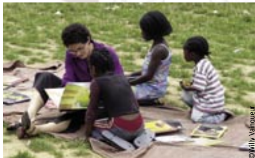
Atelier de lecture destiné aux enfants des quartiers défavorisés durant l'été.

Autant de questions qui sont autant de défis et probablement parmi les plus importants de ce XXI e siècle.