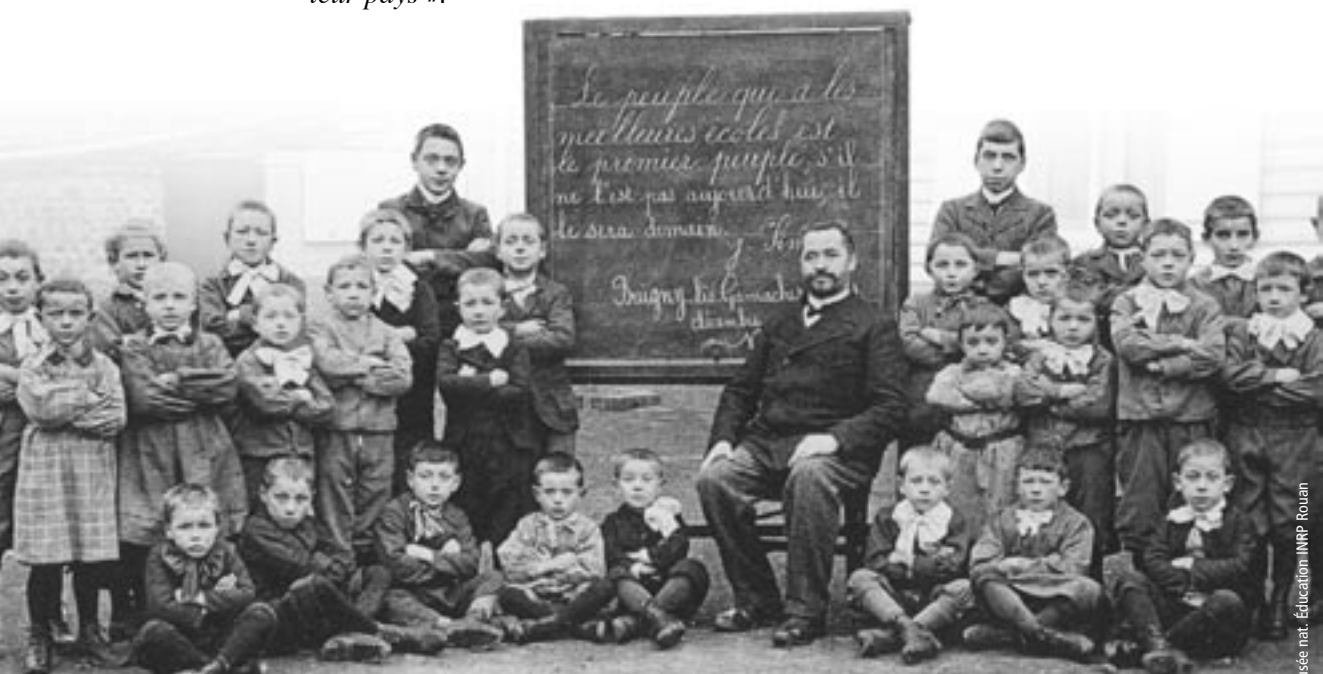
École de Baigny-des-Gamaches.

La Ligue de l'enseignement, aujourd'hui forte de 2 000 000 d'adhérents et à laquelle sont affiliées 30 200 associations, est encore aujourd'hui l'un des plus importants mouvements d'éducation populaire.