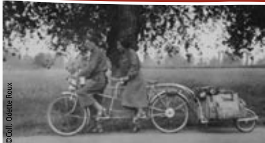
le tandem est un excellent moyen de transport pour partir en vacances