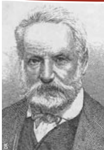
DR Victor Hugo.

CET APÔTRE DE L'INSTRUCTION LIBRE, GRATUITE, LAÏQUE ET OBLIGATOIRE AURA EU LA SATISFACTION À LA TOUTE FIN DE SA VIE DE VOIR SES SOUHAITS RÉALISÉS AVEC LES LOIS DE JULES FERRY.